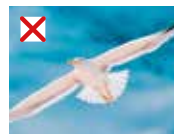
Zeemeeuw (goed antw.)