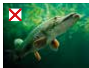
Snoek (goed antw.)